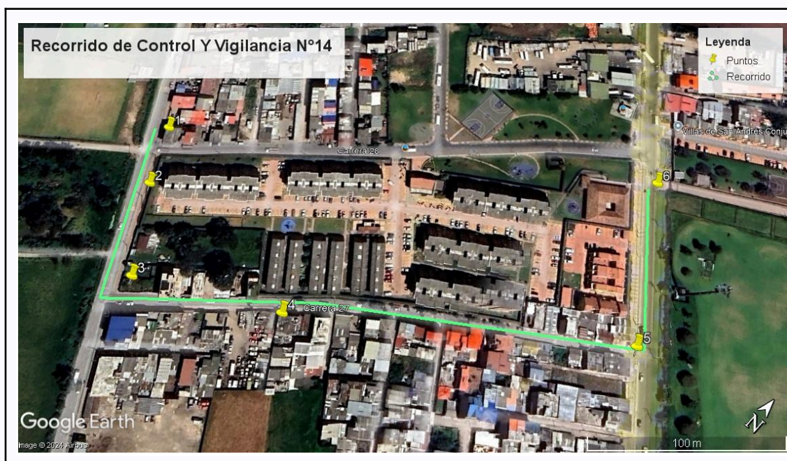
Ilustración 1. Recorrido de Control Y Vigilancia N°14

Con base en lo anterior, el día 01 de octubre del 2024 se realizó recorrido de control y vigilancia en el barrio Siete Trojes, cuadrante 3 desde las coordenadas 4°43'44,196" N- 74°13'18.594"W hasta las coordenadas 4°43'49,458" N- 74°13'10.614"W (ver ilustración 1. Ruta verde)